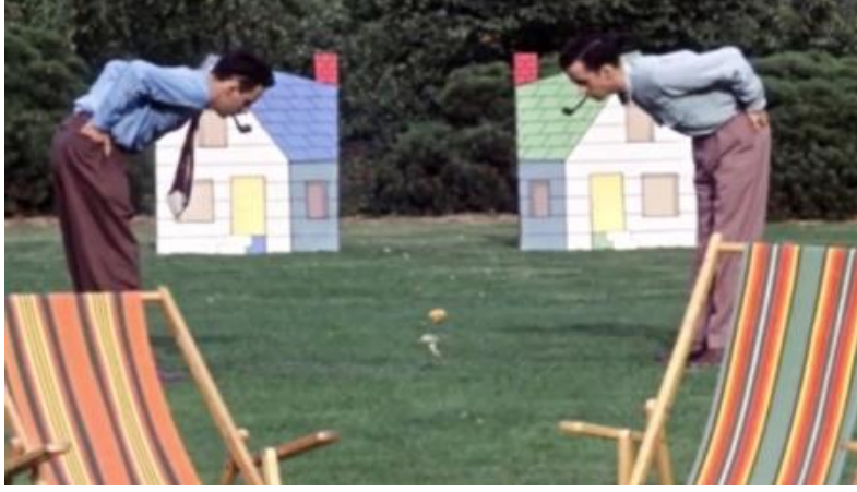
Görsel 6. Neighbours, Norman McLaren, 1952

üretilmiştir. Canlı aktörleri stop-motion nesnesi olarak kullanarak pixilation tekniğini kullanmıştır. Film, bu teknik ile McLaren'a Oscar'ı kazandırmıştır (Jordan, 1953).