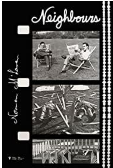
Görsel 7. Neighbours Yayın poster, Norman McLaren, 1952

Norman McLaren 1949 yılında UNESCO'ya ait olan Sağlıklı Köy Projesi üzerine çalışmak için Çin'de bulunmuştur. Çin'deki yerel sanatçılara halkı eğitmeleri için eğitim vermiştir (Christophini, 2020). O yıllarda Çin'de süren iç savaşının bitişine de tanıklık etmiştir. Creative Process: Norman McLaren belgeselinde yer alan röportajında, yerel halk ile birlikte rejimi bizzat yaşadığını ve halk ile kendini özdeşleştirdiğini belirtmiştir. Çin'den döndüğü esnada Kore savaşının patlak vermesiyle savaştan duyduğu gerilim hissi ile McLaren Komşular filmini üretmiştir (Levin, 2003). Komşular (1952), iki adamın topraktan fıskıran bir çiçeğe sahip olma hakkı için savaşa girdiği bir stop-motion animasyon tekniğinin bir parçasıdır. Bu Oscar ödüllü savaş karşıtı benzetme, McLaren'in filmlerinin hem en iyisi hem de en kötüsü olarak tanımlanmıştır.