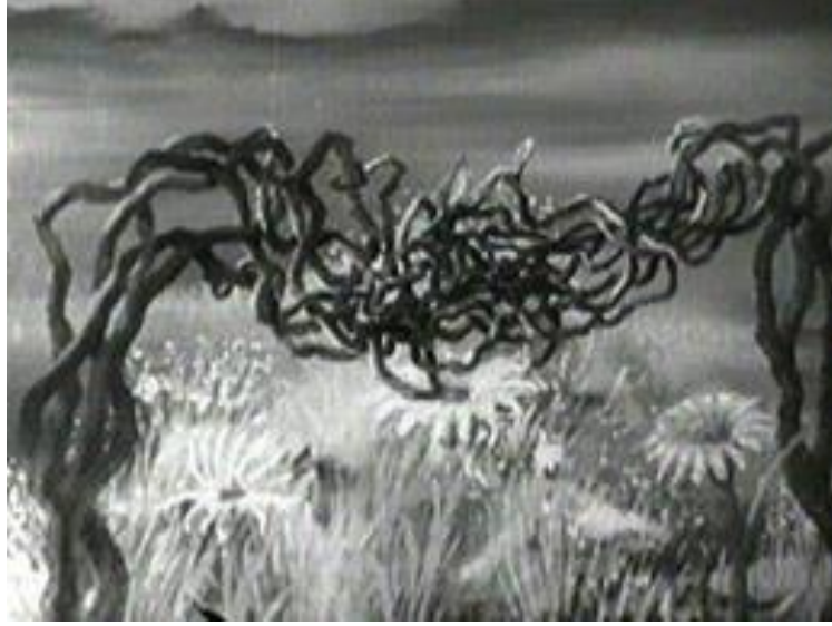
Görsel 4. Là-haut sur ces montagnes , 1946

Hen Hop 'da olduğu gibi birbiri ile bağlantısı olmayan vücut parçalarının animasyonu diyalogsuz olarak tasvir edilmiştir. 'Tavuğun Ruhu' tabiriyle ifade ettiği filmi Hen Hop için McLaren tavuk kümesinde günler süren gözlemler yapmıştır (Jordan, 1953). Bir tavuğun dansını soyutlayarak, stilize bir üslup ile aktaran McLaren'ın diğer birçok çalışması gibi Hen Hop da film stoğunun çizilmesi ile canlandırılmıştır. Picasso'nun filmi izlemesi üzerine 'nihayet yeni bir şey' şeklinde ifade ettiği söylenmektedir.