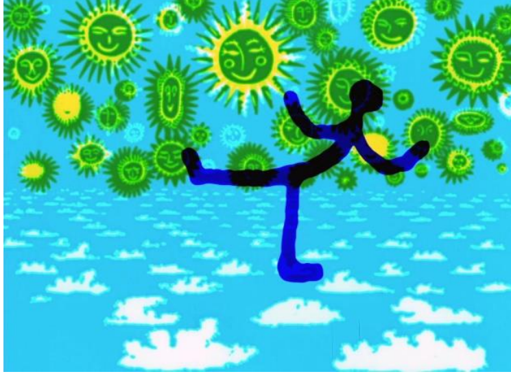
Görsel 2. Now is the Time, Norman McLaren, 1951

desenleri ve hareketleri kullanarak, izleyicinin stereografik derinliği daha iyi hissetmesini sağlamaya çalışmıştır. Bir diğer eseri olan Now is the Time (1951) da ise özellikle dans sahnelerinde stereografik derinliği vurgulayarak dansçıların ve objelerin farklı düzlemlerde hareket etmesi, izleyicilere derin bir uzay izlenimi sunmayı amaçlamıştır. Twirligig (1952) kısa filminde ise dönme hareketleri ve renklerin kullanımıyla stereografik derinliği kullanarak görsel olarak filmi zenginleştirmeye çalışmıştır.