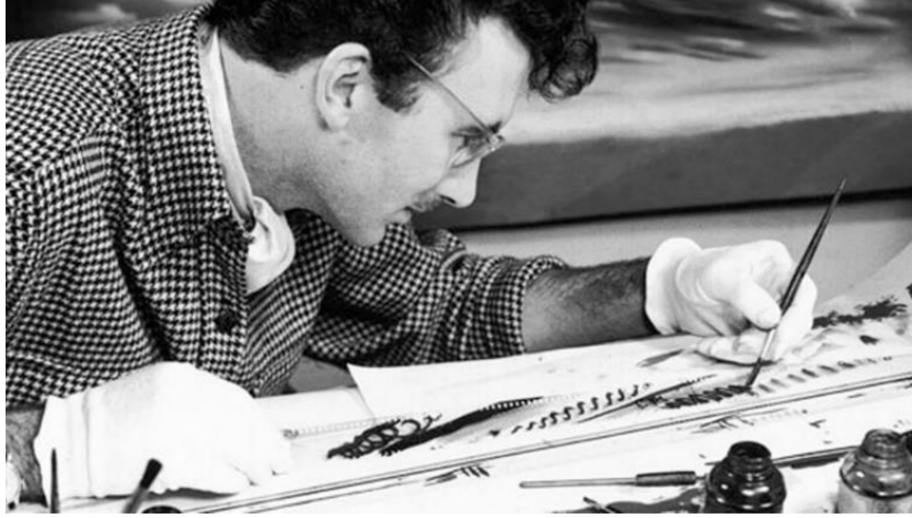
Görsel 1. Norman McLaren

merkezinde önemli bir rol almıştır. GPO’da kazandığı deneyim ve beceri McLaren’in benzersiz üslubunu yaratmasına olanak sağlamıştır.