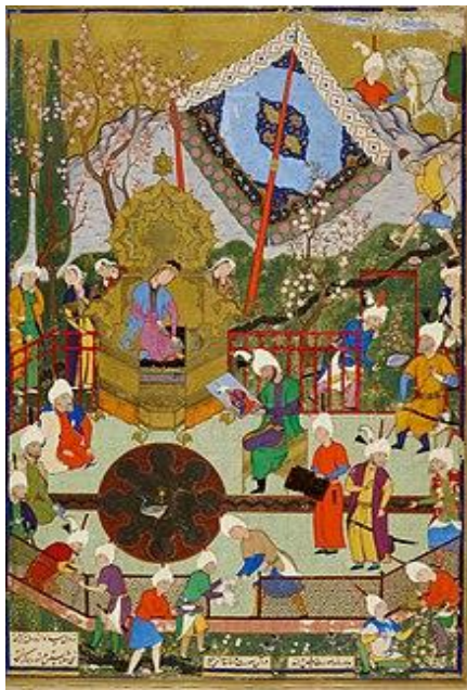
Şəkil 3. Mirzə Əli. Xəmsə “Xosrov və Şirin”. Təbriz miniatür məktəbi.

Səfəvilər dövləti yarandıqdan sonra, Təbriz Azərbaycanın əsas siyasi və iqtisadi mərkəzinə çevrilir. Bu səbəbdən XVI əsrdə Təbrizdə Azərbaycan memarlığı və DTS ilə yanaşı, miniatür məktəbi də yeni yüksəliş və inkişaf mərhələsi yaşayır. Bu dövrdə Soltan Məhəmməd, Ağa Mirək, Mir Müsəvvir, Mirzə Əli, Müzəffər Əli, Mir Seyid Əli, Mir Zeynalabdin, Siyavuş bəy, Fərrux bəy, Məhəmmədi, Sadiq bəy Əfşar, Əli Rza Təbrizi, Şahqulu, Vəlican kimi istedadlı miniatürçü rəssamlar çalışmışlar. Miniatür sənətimizin ən yüksək inkişaf mərhələsini təşkil edən XVI əsrdə yaşayıb fəaliyyət göstərmiş bu rəssamlar Azərbaycan boyakarlığını ümumdünya miqyasına çıxarmış və incəsənətimiz tarixində ona şərəfli yer qazandırmışlar.