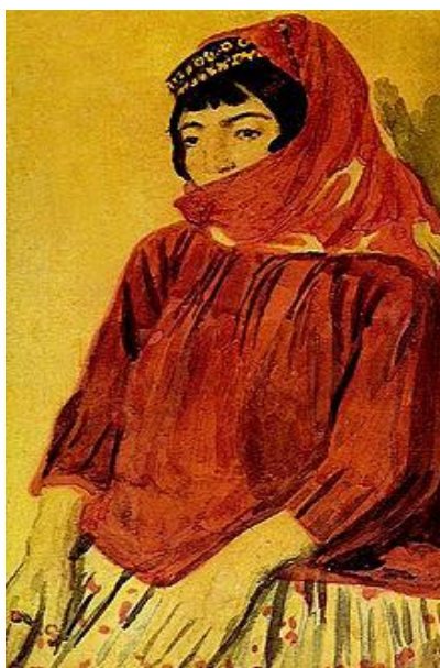
Şəkil 5. Bəhruz bəy Kəngərli. “Qaçqın qadın”.1920. Kağız sulu boya 77x53.

XX əsrin ilk onillikləri, yəni Azərbaycanda 1920-ci ildə Sovet hakimiyyəti qurulduğu dövrə kimi, onun ərazisində dəzgah boyakarlığının inkişafı Əzim Əzimzadənin və Bəhruz Kəngərlinin məhsuldar fəaliyyəti və yaradıcılığı ilə bağlı olmuşdur (Əfəndi, 2007, s.210). Öz məhsuldar yaradıcılığı ilə onlar Azərbaycan təsviri sənətində realizmin əsasını qoymuşlar, onda yeni bir dövr açmışlar, onu qabaqcıl ideya və ictimai məzmunla, yeni bədii forma və janrlarla, təsvir vasitələri ilə zənginləşdirmişlər (Şəkil 5).