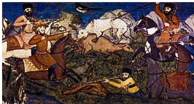
Şəkil 4. Şəki Xan Sarayı..İkinci mərtəbənin kiçik otağının frizində ov səhnəsi Usta Qənbər XVIII əsr.

Bu dövrdə Şəkiddə başqa bir evin divarları rəssam Firuz tərəfindən yerinə yetirilmiş nəbatî naxışlar, bu divarların aşağı hissələrindəki dördkünc taxçalar isə, Nizaminin “Xosrov və Şirin”, “Yeddi gözəl” və “Leyli və Məcnun” poemalarına çəkilmiş rəsmlər ilə bəzədilmişlər.