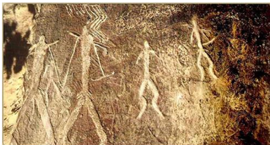
Şəkil 1: Qobustan qaya rəsmi. Bakı.

Artıq b.e.ə. I minillikdən başlayaraq b.e. VII əsrinin ortalarına - Azərbaycan ərəblər tərəfindən işğal olunduğu dövrə kimi, ölkəmiz ərazisində boyakarlıq aparıcı rol oynayır. Belə ki, vurğulanan dövr ərzində ölkəmiz ərazisində müxtəlif mərhələlərdə yaranan ilk dövlətlər -Manna, Midiya, Atropatena, Albaniya ərazisində saray və məbəd memarlığının inşasının geniş vüsət alması ona gətirib çıxarır ki, monumental boyakarlıq bu tip tikililərin interyer tərtibatının ayrılmaz elementinə çevrilir (Şəkil 2) ( Kerimov və başqaları, 1992).