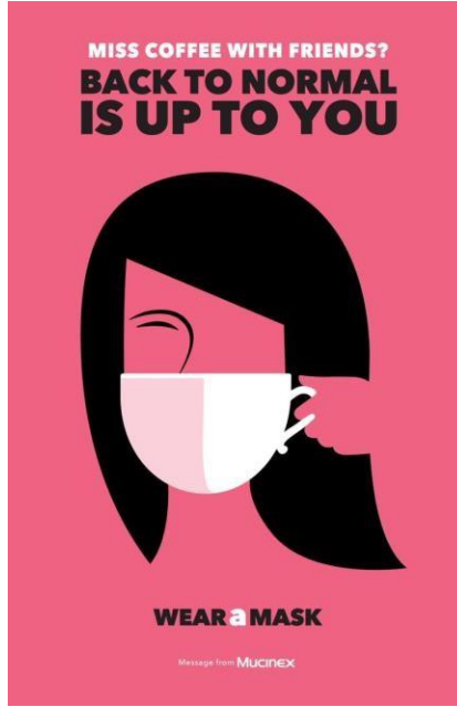
Görsel 6. Noma Bar, Maske Tak Afişi

Noma Bar tarafından tasarlanan bu afişin (Görsel 6) amacı, pandemi sırasında maske takmanın önemini vurgulamak ve insanları bu konuda teşvik etmektir. Mucinex ilaç markasının desteğiyle hazırlanan bu afiş, toplum sağlığına yönelik bir kamu hizmeti mesajı olarak tasarlanmış ve pandemi sırasında maskenin hayati rolüne dikkat çekmiştir. Bu afiş, pandemiye yönelik bir kamu sağlığı mesajını son derece etkili bir şekilde ileten güçlü bir tasarımdır. Negatif alanın yaratıcı kullanımı, sosyal hayatın özlenen yönleriyle (kahve içmek gibi) maske takmanın hayati önemini birleştirmektedir. Renklerin uyumu,