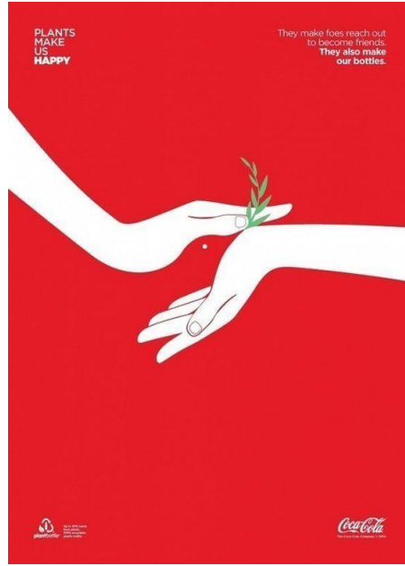
Görsel 4. Noma Bar, Coca-Cola Afişi

Görsel 4, tasarım açısından negatif alan kullanımı ve marka değerlerini görsel bir metaforla ifade etme özellikleriyle öne çıkan başarılı bir Noma Bar çalışmasıdır. Coca-Cola'nın çevresel sürdürülebilirlik vizyonunu vurgulayan tasarım, hem görsel sadeliği hem de anlatım gücüyle etkili bir iletişim aracı olarak dikkat çekmektedir. Minimalist tasarımı ve çarpıcı renk seçimiyle, izleyici üzerinde hem duygusal hem de düşünsel bir etki yaratmaktadır.