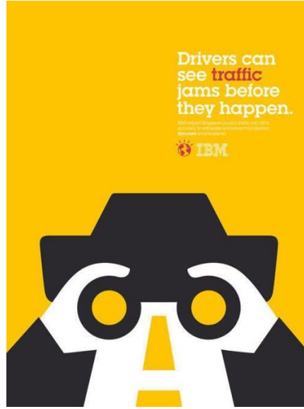
Görsel 5. Noma Bar, IBM Trafik Afişi

Noma Bar tarafından tasarlanan afiş (Görsel 5), IBM'in akıllı trafik yönetim sistemlerini tanıtarak, bu teknolojinin sürücülere ve şehir yaşamına sağladığı faydaları vurgulamak istiyor. Temel mesaj, IBM'in yenilikçi çözümlerinin trafik sıkışıklıklarını önceden tahmin ederek sürücülerin zamandan tasarruf etmesine, daha verimli ulaşım deneyimleri yaşamasına ve şehirlerdeki trafik sorunlarının azaltılmasına sağladığı katkılardır.