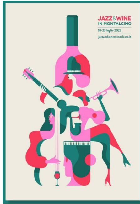
Görsel 2. Noma Bar, Montalcino, Caz ve Şarap Festivali Afişi

Görsel 2 Noma Bar tarafından İtalya'nın Montalcino Şehrinde düzenlenen caz ve Şarap festivali için 2023 yılında hazırlanan afiş tasarımıdır. Tasarım, Noma Bar'ın negatif alanı yaratıcı bir şekilde kullanma yeteneğinin önemli bir örneğidir. Aynı zamanda Noma Bar'ın negatif alanı yalnızca estetik bir araç değil, bunun yanında bir hikaye anlatımı yöntemi olarak nasıl ustalıkla kullandığını göstermektedir. Farklı unsurların bir araya gelerek hem bir bütünü hem de bağımsız detayları oluşturmaktadır.