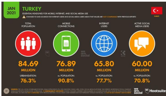
Grafik 2: Türkiye internet kullanıcı istatistikleri 2021