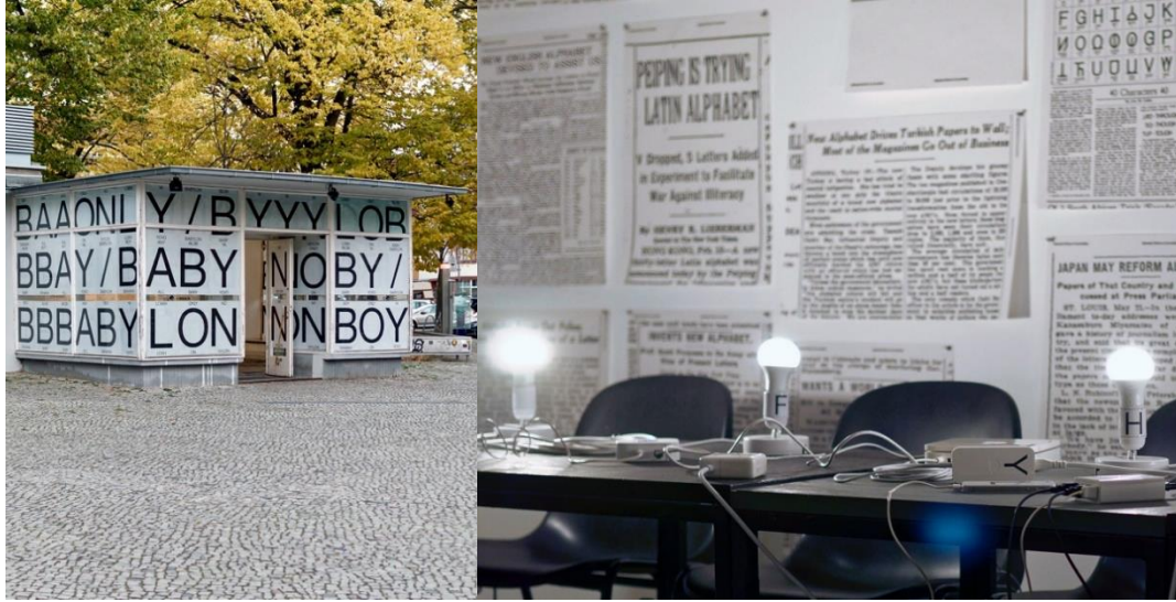
Görsel 1 “A-R-C” 2018, Experimental Jetset.

ajansların ışıltılı prodüksiyonlarına karşın yalın ama güçlü çıktılar sergilemiştir. E. Jetset müşteri ilişkilerini “ Tüm projelerimizde, mümkün olduğunca sık ve amansız bir şekilde müşterilerimizi yaratıcılığımızla rahatsız ediyoruz. ” cümlesi ile özetlemektedir. E. Jetset bunu bir tüketim kültürü ve gösteri toplumu eleştirisi olarak tartışmaya açmaktadır (Sueda, 2014). Stüdyonun bu sözü, ticari ilişkileri ve idealleri arasında bulunan hassas temasa ve stüdyonun sürdürülebilirliği ya da varlığının devamlılığı için bu ilişkinin dengede tutulması gerekliliğine işaret etmektedir.