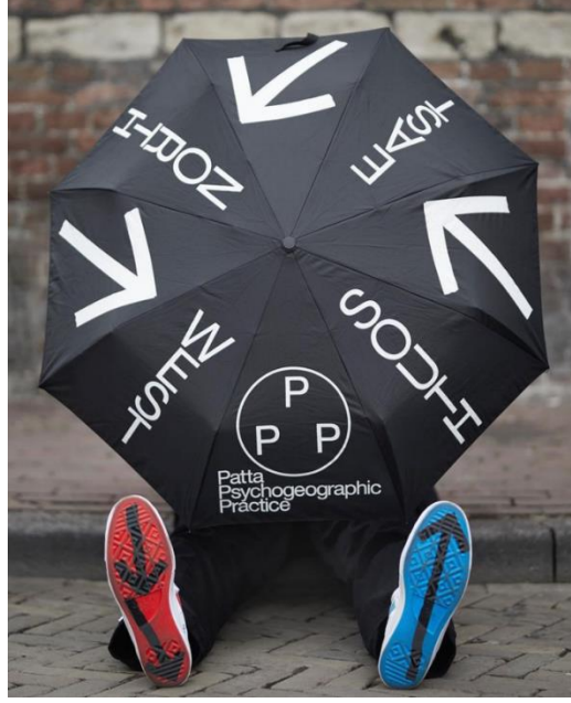
Görsel 3 “Patta Psychogeographic Practice” 2022, Experimental Jetset.

arasındaki deneyselliğe açık bir eğilime sahiptir. Stüdyonun tasarımlarındaki minimalist indirgemecilik kavramsal boyutta da bir yalınlığa ulaşmak amacı taşımaktadır.