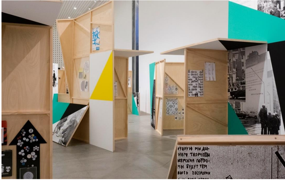
Görsel 8 “Superstructure” 2018, Experimental Jetset.

2018 yılında RMIT Üniversitesi ve E. Jetset iş birliği ile Melbourne’de gerçekleşen “Superstructure” adlı enstalasyon dil ve şehir arasındaki ilişki temasına odaklanmaktadır. Bu projede şehrin tamamı grafik bir dil ve grafik tasarım stratejileri ile şekillendirilebilecek ya da yeniden inşa edilebilecek bir platform olarak görülmektedir. Proje büyük ölçüde Konstrüktivizm, Situasyonist Enternasyonal, Provo ve Post-Punk olmak üzere dört hareketten esinlenerek şehrin dilini biçimlendirmektedir (Jetset, 2018). Taşçıoğlu’na göre; kent, grafik tasarımın tüm etkisinin görülebileceği bir sahneye benzemektedir (Taşçıoğlu, 2013). E. Jetset grafik tasarım stüdyosu tarafından kurgulanan ve tasarlanan proje, bir retrospektif serginin, enstalasyonun, deneysel tipografik posterlerin veya bir sergileme tasarımının bir arada