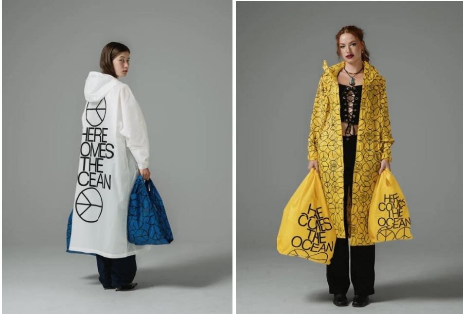
Görsel 4 “SB Capsule Collection” 2022, Experimental Jetset.

E. Jetset’in, Susan Bjil markasının iş birliğiyle iklim krizine dikkat çekmek için tasarladığı “SB Capsule Collection” özellikle plastik atıklar sebebi ile kirlenen çevre ve yükselen deniz seviyesi tehlikesine “Here Comes The Ocean” (İşte Okyanus Geliyor) sloganı ile vurgu yapmakta ve görselleştirmektedir (Jetset, 2022). Stegall’a göre alternatif tasarım yaklaşımının sürdürülebilir biçimlerde gelişebilmesi için tasarımcının diğer disiplinler ve çevresi ile duyarlı bir bağ oluşturması ve uzmanlık alanından bu ağa katkı sunması