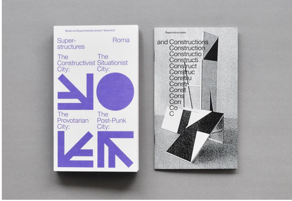
Görsel 7 “Superstructures (Notes on Experimental Jetset / Volume 2)” 2021, Experimental Jetset.