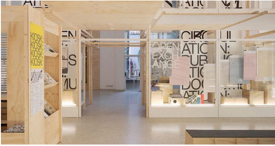
Görsel 5 “How Posters Work” Cooper Hewitt Design Museum 2015, Experimental Jetset.

gerekmektedir (Stegall, 2016: 176). Dunne ve Raby'ye göre ise iklim krizi gibi olası büyük felaketler ya da çok daha basit gündelik problemler karşısında tasarım çözümleri üretebilmek, problemleri içselleştiren ve sorgulayan bir tasarımcı olmaktan geçmektedir (Dunne ve Raby, 2013: 02). E. Jetset, çalışmalarında öne çıkardığı bir konu olarak şehrin dilinin orada yaşayan insanların psikolojisi için çok önemli olduğunu ve grafik tasarımcıya bu konuda önemli bir rol düştüğünü ifade etmektedir. Özellikle “Patta Psychogeographic Practice” adlı tasarım projeleri bunu vurgulamak için ürettikleri tasarımlarından biridir (Patta Psychogeographic Practice, 2022). E. Jetset alternatif ve eleştirel bakış açılarını çok yönlü olarak ürettiği projelerine yaymaya çalışmakta ve sloganlarını mümkün olduğunca minimal ve anlaşılır biçimlerde kullanmaktadır.