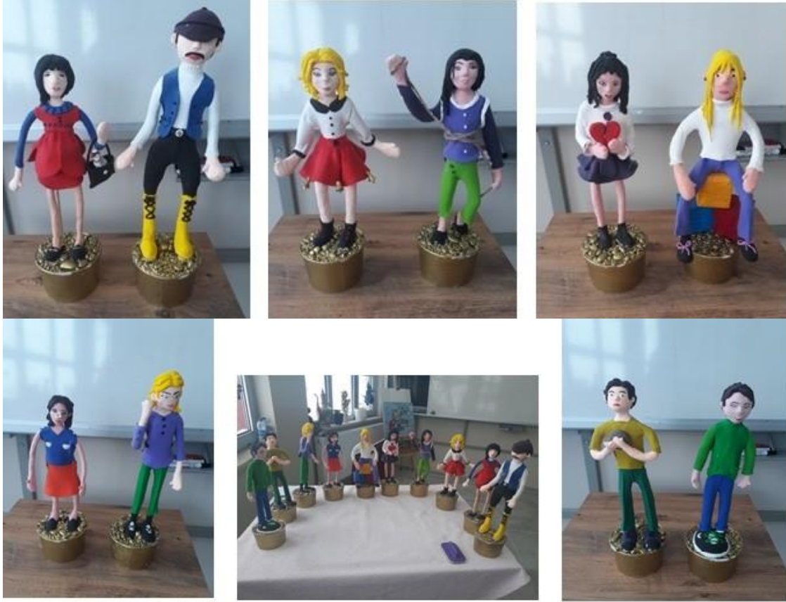
Resim 4. Deyim bebeklerinin tamamlanması