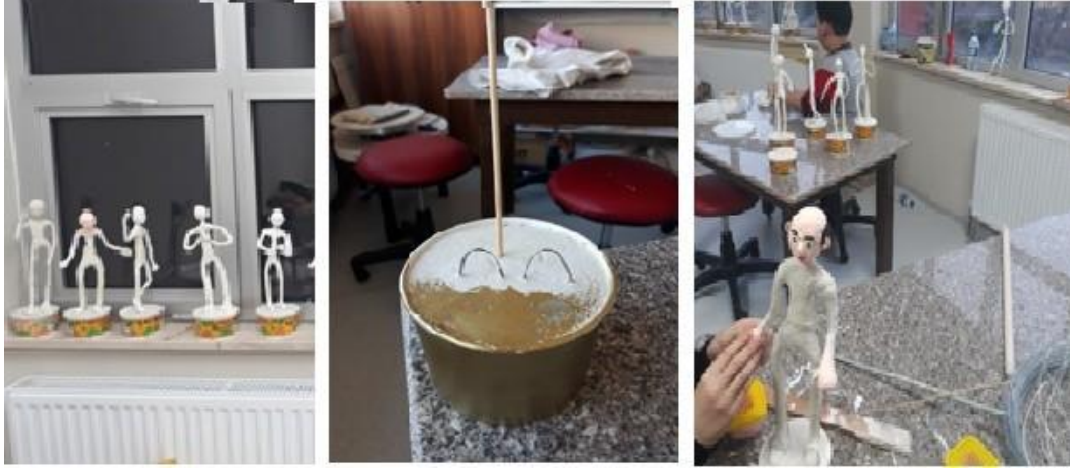
Resim 2. Kaidenin hazırlanarak bebeklerin kaideye tutturulması