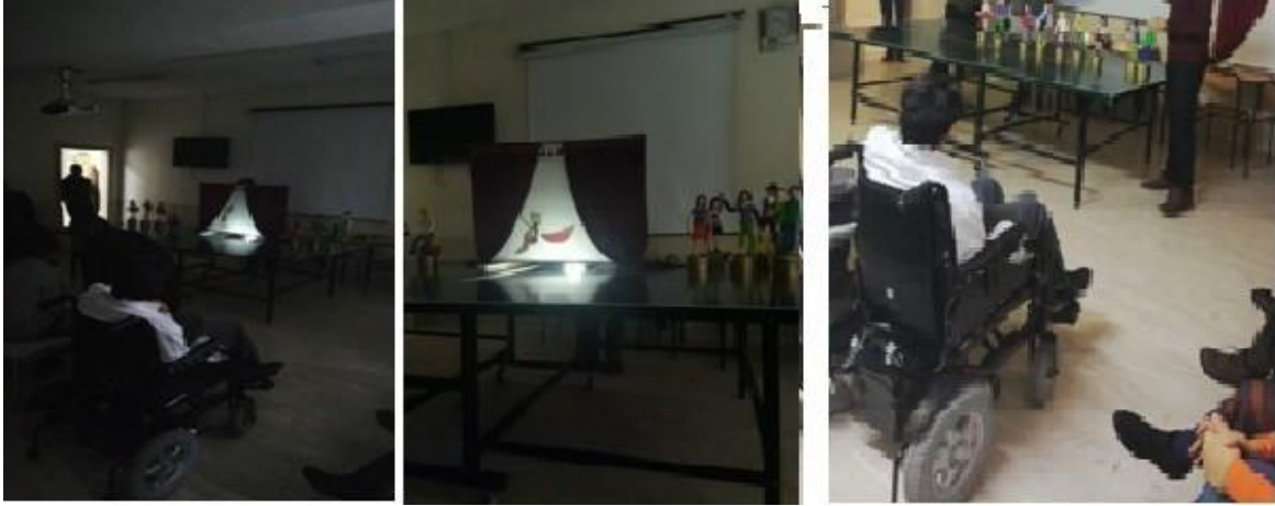
Resim 5. Deyimler etkinliğinin özel eğitim kurumunda uygulanması