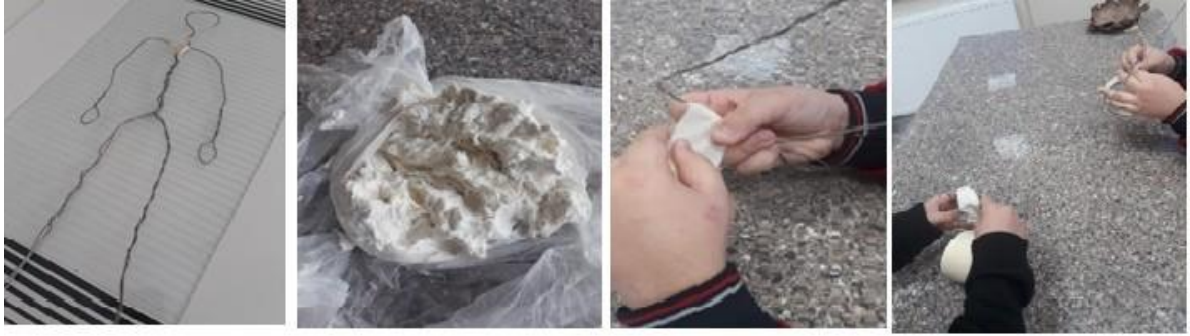
Resim 1. Deyim bebeklerinin iskeletinin hazırlanması ve kâğıt hamuru yapımı

Deyim bebeklerin iskeleti pense ile şekillendirilerek telleri kâğıt hamuruna tutturabilmek için kâğıt bant ile sarılmıştır. Nişasta, kâğıt ve tutkal ile kâğıt hamuru hazırlanmıştır. (Resim 1).