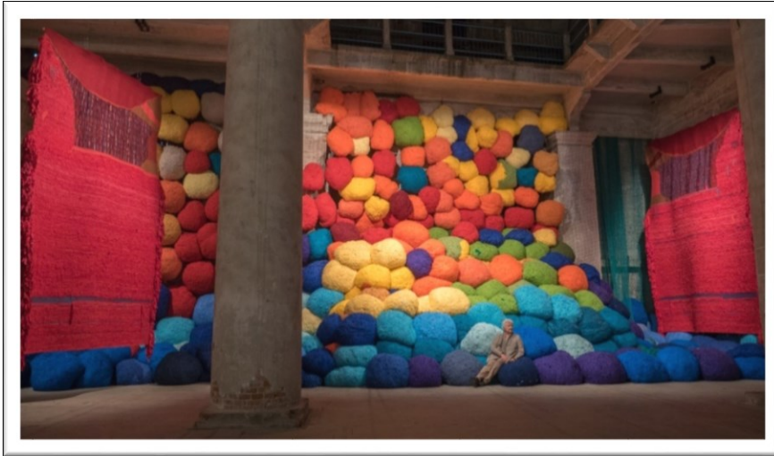
Görsel 4. Sheila Hicks, Enstalasyon. Erişim: 01.01.2023, https://www.sheilahicks.com/

Söz konusu tekstil olduğunda çeşitli tekniklerle hacimsel formlar yakalayan heykel ve lif sanatını yakınlaştıran pek çok sanatçı olmuştur. Geleneksel yöntemlerle dokuma tezgâhında dokuma yapan Lenore Tawney şeritler halinde bölerek dokuduğu tapestry’lerle özgün ve soyut arayışlara girerek form ve hacim ilişkisinde espası değerlendirmiştir (Görsel 2). Claire Zeisler ise serbest düğüm tekniğine dayanan oldukça büyük ölçekte makrome yapılarla formlar inşa etmiştir (Görsel 3).