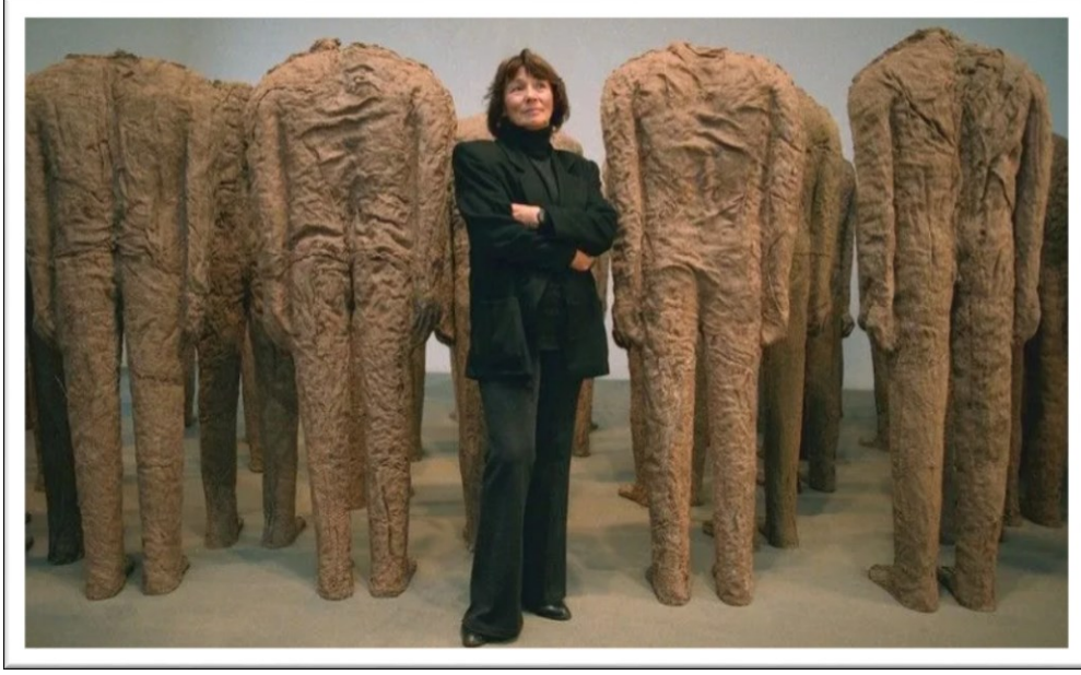
Görsel 5. Magdalena Abakanowicz, Erişim: 01.01.2023, https://gloswielkopolski.pl/instalacja-magdaleny-abakanowicz-sprzedana-za-8-mln-zl-nalezala-do-kolekcji-robina-williamsa/ar/c13-14544283

Sheila Hicks sarılmış ve dikilmiş modüler parçaları deneysel dokumalarla şekillendirmiş kendine özgü renklendirme yaparak sonlandırmıştır (Görsel 4). Enstalasyonlar yaparak tekstilin mekân içindeki yerini de sorgulamış ve devasa yapılarıyla o güne kadar olan tekstil algısını ironik bir biçimde yıkarak, görsel imaj temelli belleklere tekstil heykellerini farklı alanlara konumlandırarak uygulamıştır.