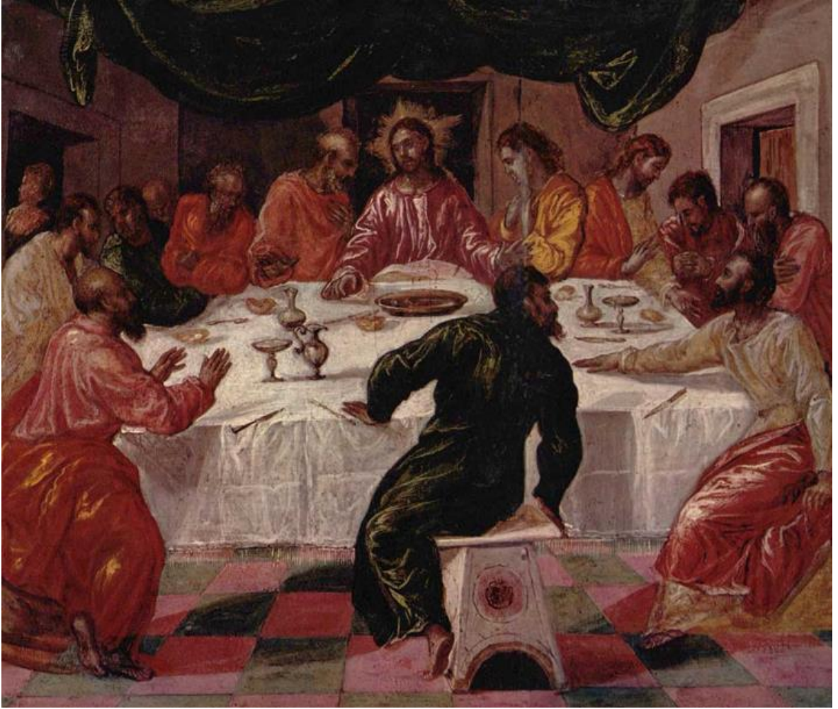
Resim 4: El Greco "Son Akşam Yemeği" (1596), Panel Üzerine Yağlıboya, 43 x 52 cm, Pinacoteca Nazionale Di Bologna

neticesidir. O dönemde, özellikle İspanya'da, Orta Çağ Mistisizmi hala sürmekte, dünyadan kaçma, kendi içine dönme, imajlar dünyasına dalma ve dini yaşanmışlıklara bu yolla samimiyet ve derinlik katma, Orta Çağ'daki mistik akımların ortak özelliği olarak göze çarpmaktaydı. El Greco'nun sanatı, bu duyuşun bir sözcüsü olmuş ve onu yaşadığı çağda, öznellikliğin insanın kendini, ruhunu yakından bilme, tanıma isteğinin resimdeki temsilcilerinden biri haline getirmiştir. Rönesans sanatçıların aksine, o bu dünyayı dışarıdan seyretmemiş, içinde yaşamış, kendisi de onu içinde duyumsamıştır. Daha çok dini konulu, manevi ve ruhani yönü kuvvetli resimler yapmıştır (Resim 5). 1624 yılında ölünce Santa Domingo Kilisesine gömülen El Greco'nun oğlu olan J.Manuel, sanatçının bütün resimlerini çeşitli özelliklerine göre ayırmış ve bir araya getirmiştir. Böylece 200'e yakın tablo toplanmıştır.