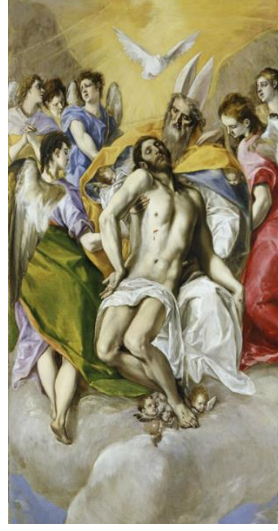
Resim 1: El Greco "Kutsal Üçlü" (1577), Tuval Üzerine Yağlıboya, 300 x 179 cm, Museo Del Prado, Madrid