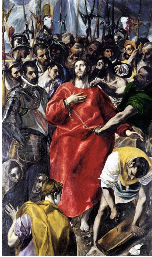
Resim 5: El Greco "Tutuklanış" (1579), Tuval Üzerine Yağlıboya, 285 x 173 cm, Metropolitan Museum Of Art, New York

Başlıca eserleri; Son Akşam Yemeği-1596, Kutsal Üçlü-1577, Tutuklanış-1579, Göğe Yükseliş-1614, Diriliş-1600, Bahçede Acı Çekme-1590, Körün İyileştirilmesi-1569, Toledo'ya Bakış-1610, İncilci Yahya-1595, Çarmıha Geriliş-1600, Meryem'e Müjde-1612, Çobanların Bağlılık Sunuşu-1614 ve İsa'nın Vaftiz Edilişi-1596 vb. daha birçok başyapıt sayılabilecek eser bırakan El Greco'nun resimleri İspanya, Amerika gibi yerlerdeki dünyaca ünlü müzelerde sergilenmektedir.