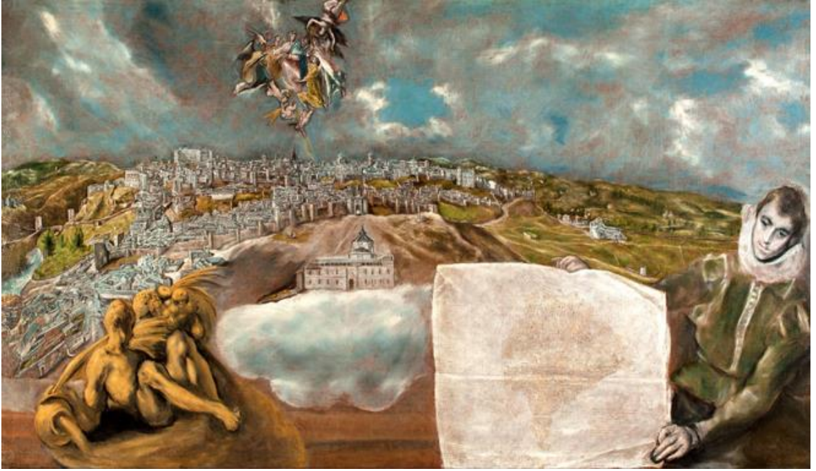
Resim 3: El Greco "Toledo'ya Bakış" (1610), Tuval Üzerine Yağlıboya, 132 x 228 cm, El Greco Museum, Toledo

Çağ Mistisizminin hakim olduğu İspanya iklimi ve ruhuyla birleşerek onun yaratıcılığında ve üslubunda yer almıştır. Zaman ve perspektif unsurlarının yer almadığı mekânlarda, hayaletler kalabalığını andıran figürleri, yalazlar gibi kıvrılan biçimleri, dış gerçekliğe benzetme çabası olmadan yaratılmıştır. El Greco bu şekilde mistik tecrübelerini yapıtlarında göstermiştir. Eserlerinde, oldukça samimi ve spontane bir çalışma, ruhani sayılabilecek derin ve ezoterik bir ruhsal coşku gözlenmektedir. Bu yapıtlarında gerçek dünya ile hayal dünyası çok ince bir sınırla ayrılmış gibi durmaktadır. Bunlar sürekli birbirlerine dönüşerek izleyenin gözünde bir başkalaşım, bir değişim etkisi oluşturmaktadır. El Greco'nun sanatı, bu son demlerinde daha dışavurumcu, daha üslupçu ve daha dinsel bir şekle dönüşmüştür. Formlar daha çok zorlanıp değiştirilmiş, sübjektiflik son merhaleye ulaşmıştır. Formların arasındaki bağlantılar azalmış, renk kullanımı ise daha belirgin ve daha canlı olmuştur.