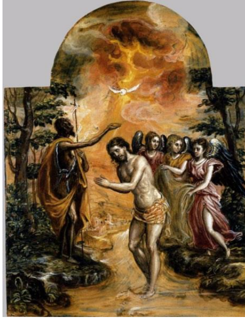
Resim 6: El Greco "İsa'nın Vaftiz Edilişi"(1596), Ahşap Pano Üzerine Tempera, 24 x 18 cm, Museo Del Prado, Madrid

analiz etmeye başlamadan önce bu eserin El Greco'nun özgün bir anlatımı olduğunu eklemek gerekir. Yani, 24 x 18 cm ebatlarında yapılan bu eserde, İncil'deki hikâyenin El Greco tarafından yorumlanmış versiyonu resmedilmiştir.