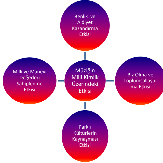
Şekil 2. Bu makalenin araştırmacıları tarafından geliştirilmiştir.