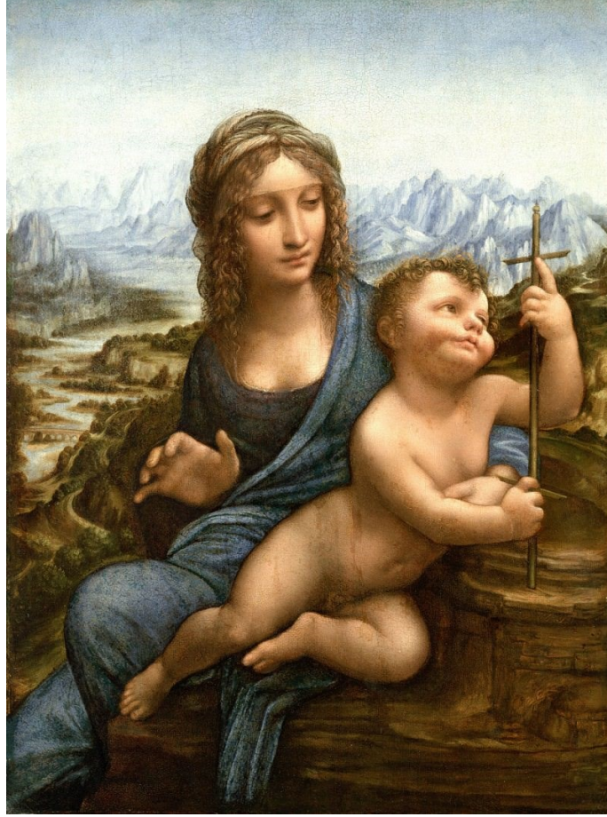
Leonardo da Vinci "Mağaradaki Madonna"

katılım ve iletişimde nasıl etkileşime girdiğini ve jest ve ifade alışkanlıklarını yakından inceledi. Bu, belki de neden bu dönemden kalma bu kadar az tablosu olduğunu açıklamaya yardımcı olan zaman alıcı ve özenli bir girişim olduğu görmekteyiz. Toplamda sadece altı, ya şimdi kaybedilen ya da hiç başlamayan üç komisyon önerisiyle birlikte yine de olağanüstü büyük bir çizim kütüphanesi bırakan Leonardo'nun gözlem konusundaki ustalığının ve insan duygularını iletme yeteneğinin kanıtı olduğunu görmekteyiz.